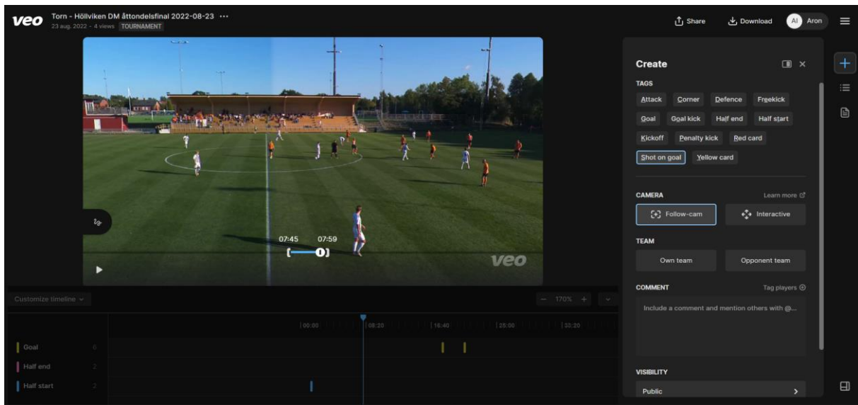
Bild på hur editorn ser ut och hur man skapar klipp.