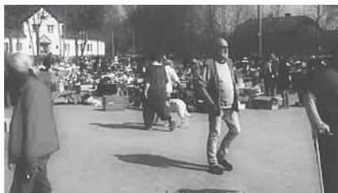
Loppmarknaden under 80-talet.