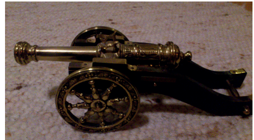
En ny tävling anordnades, Kanoncupen. Ovan ses vandringspriset som skulle erövras 3 gånger för att tillfalla segraren.

Hösten 1965 anmäldes även ett pojklag att delta i Pojklagspokalen i Skåne. Allt var dock uppenbarligen inte frid och fröjd. I