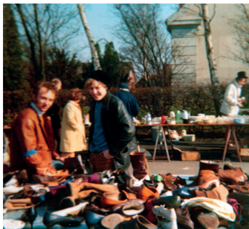
Bild från Loppmarkanden tidigt 70-tal.

Under slutet av 60-talet engagerades ett litet tivoli från Österlen att delta och detta lockade dit fler barnfamiljer. I slutet på 90-talet och början 2000-talet minskade dock intresset och det blev svårt att motivera föreningens medlemmar att ställa upp och hjälpa till. 2002 var sista året som Torns IF deltog i loppmarknaden som sedan dess har fortsatt att drivas i Torns Scoutkårs regi.