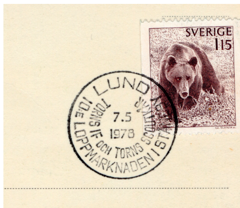
Till den 10:e loppmarknaden, 7 maj 1978, togs det fram en speciell poststämpel.: TORNIS IF och TORNIS SCOUTKÅR, 10:e LOPPMARKNADEN I STÅNGBY