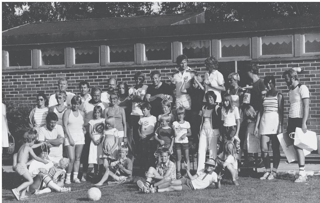
Ett gäng glada gamesamlare.

På 1980 talet hade man också något som kallades Gamesamlartävlingar. Då träffades de som ville vara med på söndagseftermiddagar, man lottade ihop dubbelpar som spelade mot varandra under ett visst