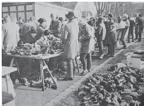
Den första loppmarknaden 29 mars 1969