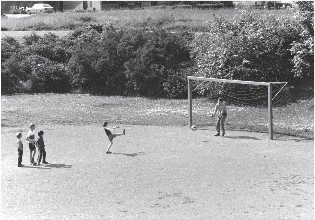
Fotboll i grustaget i Vallkärra, 1979.