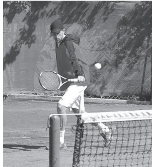
Andreas Vinciguerra spelar tennis i Stångby.