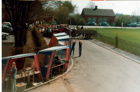
Bilder från Loppmarkanden tidigt 70-tal.